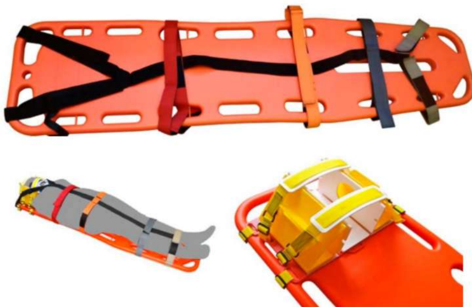
Рис 3. Щит спинальный УХН-1А6А и фиксатор головы ФГС-01-Медплант