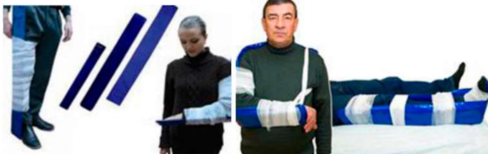
Рис 1. Наложение и закрепление лестничных шин при различных переломах

К шинированию при повреждениях конечностей предъявляют следующие требования: при переломах шина должна быть такой длины, чтобы она захватывала не менее двух соседних суставов (один к центру, а другой к периферии от места перелома); шина должна быть прочной и в то же время не должна нигде оказывать травмирующего давления на подлежащие ткани.